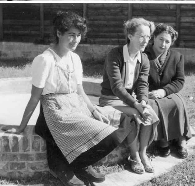
Vista del CEIS nell'immediato dopoguerra. Sullo sfondo di una Rimini appena ricostruita dopo i bombardamenti, il Tempio Malatestiano.