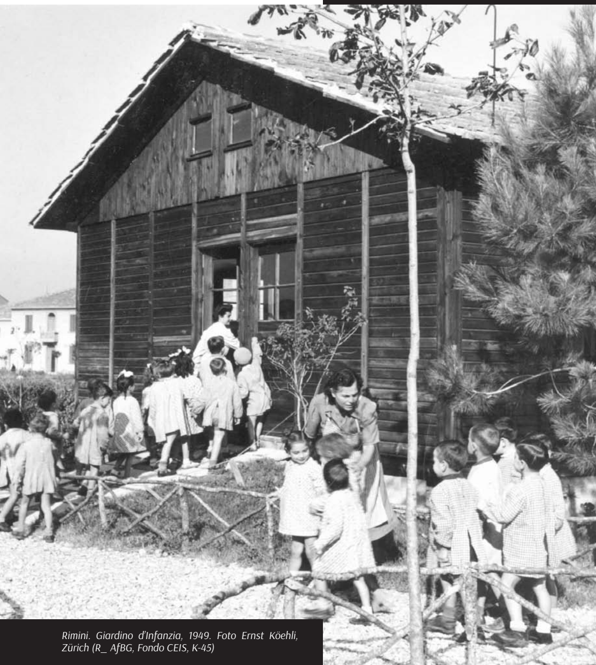
Rimini. Giardino d'Infanzia, 1949.