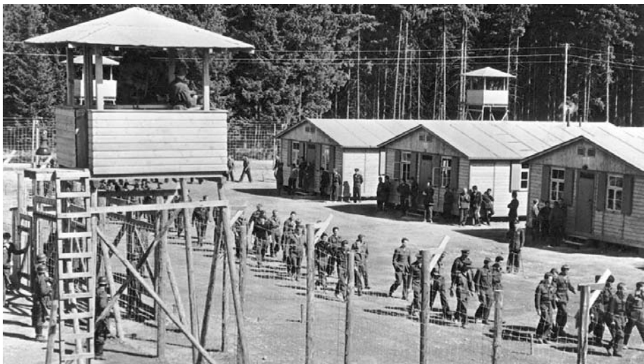
Il montaggio delle baracche, 1946.

Un fotogramma del film La grande fuga diretto da John Sturges, in cui si vedono le baracche del campo di prigionieri molto simili a quelle del CEIS