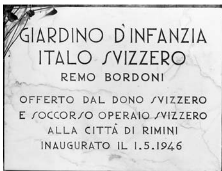
Rimini. Giardino d'Infanzia, 1949.

In tale prospettiva, la ricerca che presentiamo continua a muoversi nel solco tracciato allora, per fare luce su una realtà architettonica che ne ingloba un'altra ben più antica, l'anfiteatro romano, tornato a nuova vita proprio grazie all'innesto di una presenza stabile e vivace.