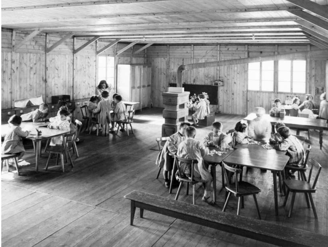
Rimini. Giardino d'Infanzia, 1949.

perfettamente alle richieste che in questo mezzo secolo le ha viste essere dimora per prigionieri, rifugio per orfani e sfollati ed aule di scuola! Tant'è che nella stessa intervista alla domanda se adopererebbe di nuovo questi manufatti per costruire oggi un centro sociale o una scuola, Margherita, rispondeva «Sicuramente. Richiedono molta manutenzione, e questo è uno svantaggio, ma il vantaggio è che sono trasformabili all'interno e facilmente adattabili a nuovi bisogni». Qualità dimostrate in tutti questi anni e convalidate dai recenti monitoraggi e dagli studi sul loro microclima 24 . Questi edifici, quindi, solo all'apparenza 'poveri' e 'inefficienti', riteniamo possano essere classificati, a buon diritto, come beni culturali, forse unici nel loro genere, almeno nel panorama europeo, se non altro in termini di consistenza e storia, apparendoci come «testimonianze materiali aventi valore di civiltà» secondo la ben nota definizione della Commissione Franceschini, che data al 1964, ma che tutt'oggi rimane valida e del tutto condivisibile.