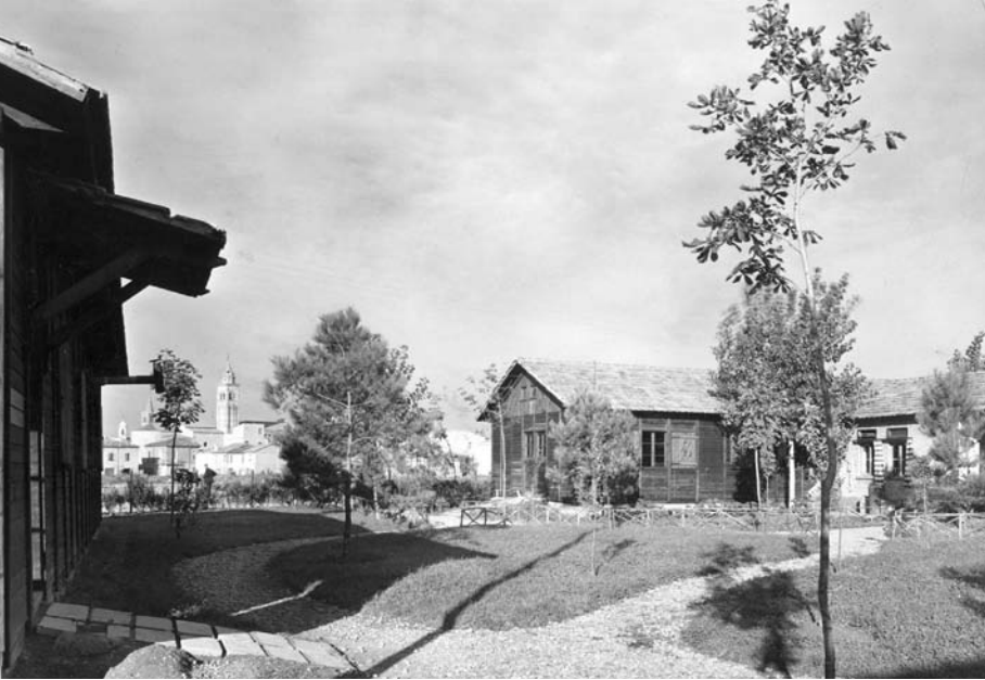
Rimini. Giardino d'Infanzia, 1949.