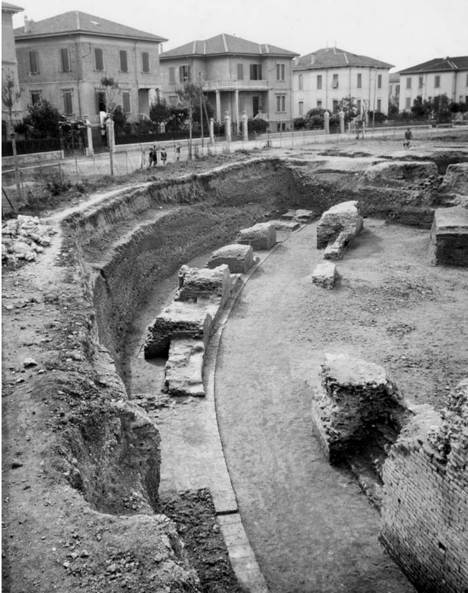
Rimini, Anfiteatro romano. Documentazione di scavo, 8 ottobre 1938. Si osservi il dislivello fra la strada ed il piano d'uso dell'anfiteatro.

urbanistica, e non di poco conto, visto il dislivello di circa tre metri fra il sedime del manufatto e una città viva che si è tanto trasformata in questi anni arricchendosi di scuole, strade ed abitazioni che sono cresciute relazionandosi proprio alla qualità di questo luogo. A questo aggiungerei un secondo, a mio avviso forse di