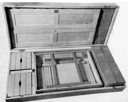
Il "pacco mobili"; il fotogramma è pubblicato in DE LUIGI T. ET AL., 1996, Memoria... cit., p. 41

che verrebbe alla luce? Aspetti questi poco affrontati (per non dire mai!) da chi propone la messa in luce dell'anfiteatro a dispetto di carte e raccomandazioni nazionali e internazionali relative alla tutela del patrimonio. Il problema della conservazione programmata dei beni culturali, così poco spendibile politicamente, ha costituito e costituisce argomento di lunghe quanto purtroppo infruttuose riflessioni accademiche ed istituzionali. È triste che proprio un archeologo scriva dei suoi colleghi che questi tendono «spesso a sopravvalutare ciò che hanno rinvenuto e sottopongono povere strutture a inutili e costosi restauri, lasciando invece spesso importanti rovine senza cure e spiegazioni» 18 . Riflessione per altro condivisibile, se si osserva lo stato di conservazione di molte delle domus scavate a Rimini (ad eccezione di quella ben nota "del Chirurgo"), musealizzate e poi abbandonate a se stesse il più delle volte per mancanza di risorse per la loro manutenzione.