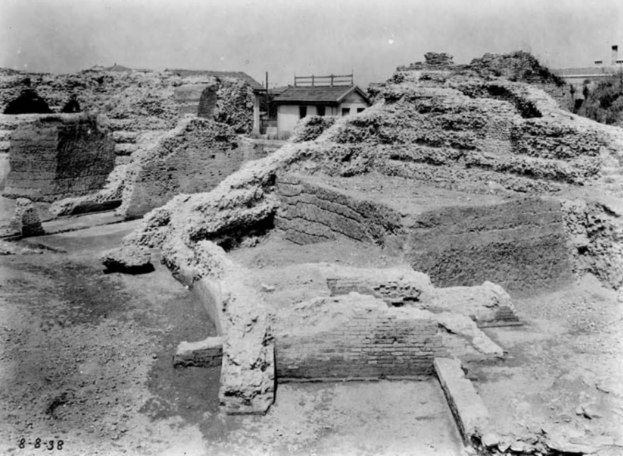
Rimini, Anfiteatro romano. Documentazione di scavo, 8 agosto 1938. Resti del terrapieno di sostegno della cavea. Fotografo non identificato (R_AfBG, AF/BC, inv AF/BC, inv. AFP 801/7)