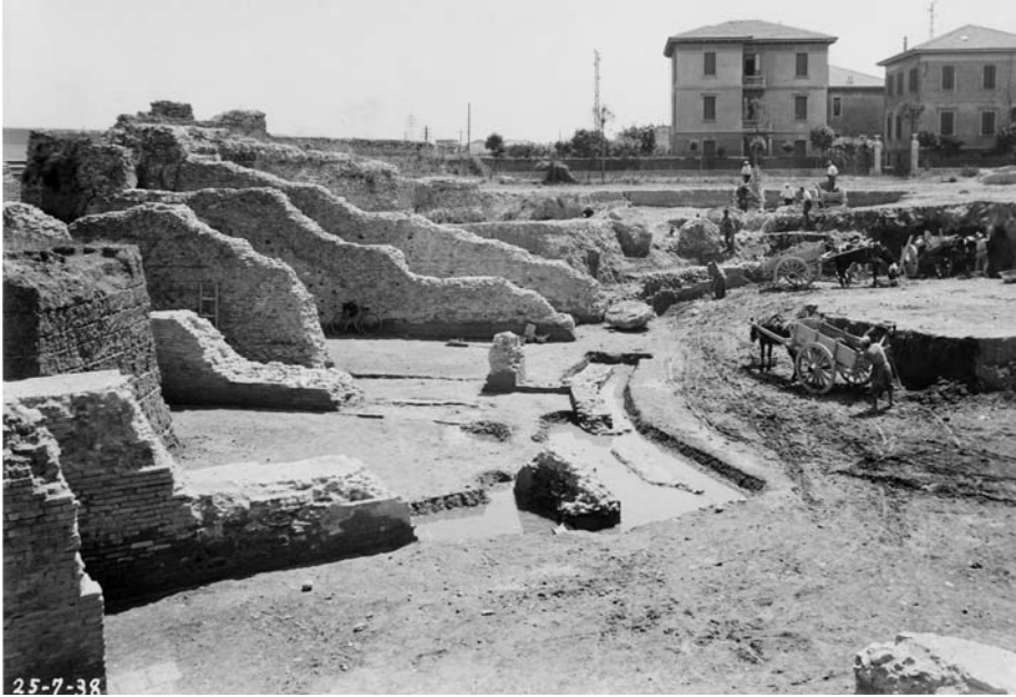
Rimini, Anfiteatro romano. Documentazione di scavo, 25 luglio 1938.